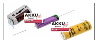
Standardlithium- batterien mit Ableiter