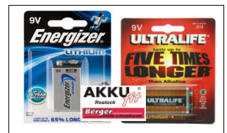
Standardbatterien für z.B. Rauchmelder