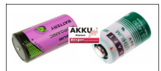
Standardlithium- batterien ohne Ableiter