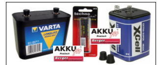
Stab- und Blocbatterien